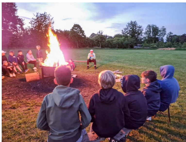
Schoolkamp 2024, groepen 8

Schoolregels zijn ook overblijfregels. Zie voor meer informatie onze website ( www.bsscharn.nl )