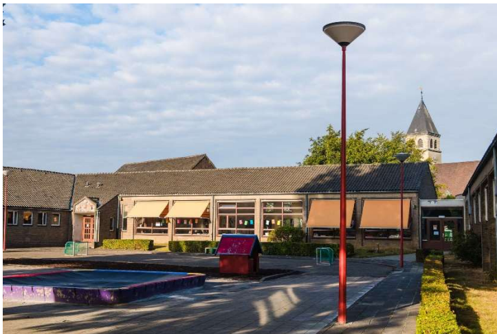
Het huidige gebouw Van Basisschool Scharn.