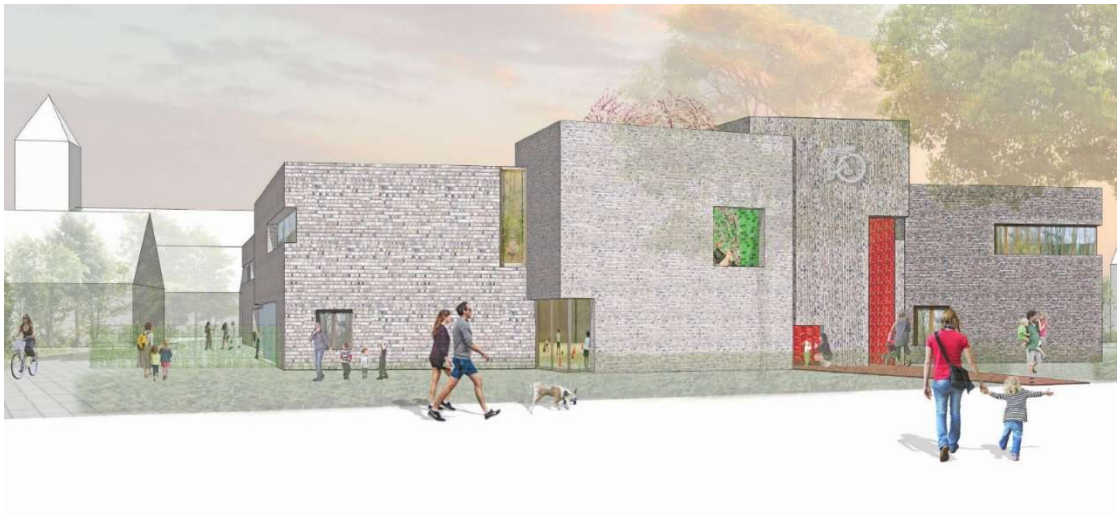
Artist impression van de mogelijke nieuwbouw.